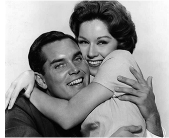
1960 LE TÉMOIN SILENCIEUX (Key Witness) de Phil Karlson avec Pat Crowley