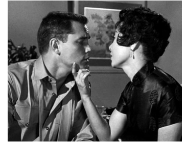
1960 SAÏPAN (Hell to Eternity) de Phil Karlson avec Miko Taka