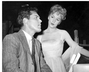
1961 L'ÉTAU SE RESSERRE (Man Trap) d'Edmond O'Brien avec Stella Stevens