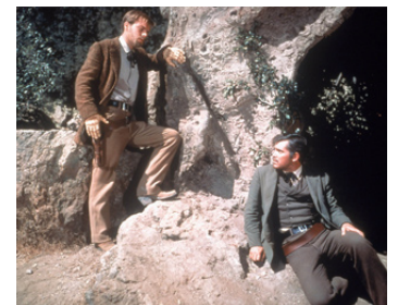
1956 LE BRIGAND BIEN-AIMÉ (The true story of Jesse James) de N. Ray avec B. Elliott, R. Wagner