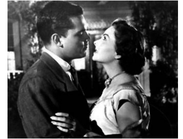
1952 SIX FILLES À MARIER (Belles of their Toes) de Henry Levin avec Jeanne Crain