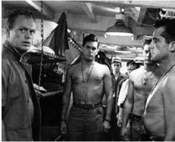
1951 LES HOMMES GRENOUILLES (The Frogmen) de Lloyd Bacon avec R. Widmark, Dana Andrews