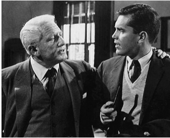
1958 LA DERNIÈRE FANFARE (The last Hurrah) de John Ford avec Spencer Tracy