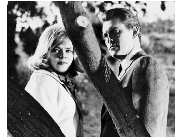
1965 LE CRIME D'UN AUTRE (Brainstorm) de William Conrad avec Anne Francis