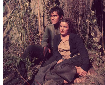
1952 PRISONNIERS DU MARAIS (Lure of the Wilderness) de Jean Negulesco avec Jean Peters