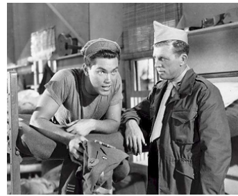
1950 AVENTURE À TOKYO (Call me Mister) de Lloyd Bacon avec Dan Dailey