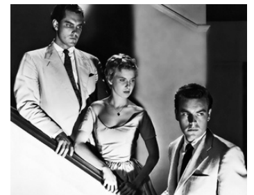
1956 L'ÉTREINTE FATALE (A Kiss before dying) de G. Oswald avec Joanne Woodward, R. Wagner