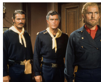
1967 CUSTER, L'HOMME DE L'OUEST (Custer of the West) de Robert Siodmak avec Robert Shaw