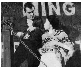
1966 DIMENSION 5 (Dimension 5) de Franklin Andreon avec France Nuyen