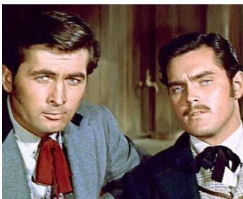
1956 L'INFÉRIEURE POURSUITE (The great Locomotive Chase) de F. Lyon avec Fess Parker