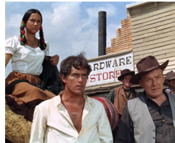
1964 MURIETA (Joaquin Murrieta) de George Sherman avec Arthur Kennedy