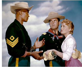
1959 LE SERGENT NOIR (Sergeant Rutledge) de J. Ford avec Woody Strode, Constance Towers