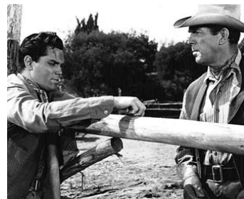
1956 UNE ARME POUR UN LÂCHE (Gun for a Coward) d'Abner Biberman avec F. MacMurray