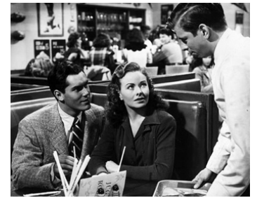
1951 LE TEMPS DES CERISES (Take care of my little Girl) de Jean Negulesco avec Jeanne Crain