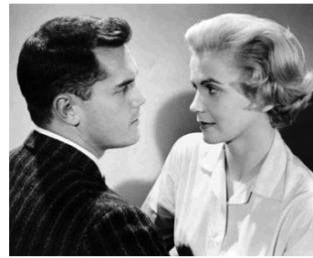
1957 CINQ SECONDES À VIVRE (Count five and die) de Victor Vicas avec Annemarie Düringer