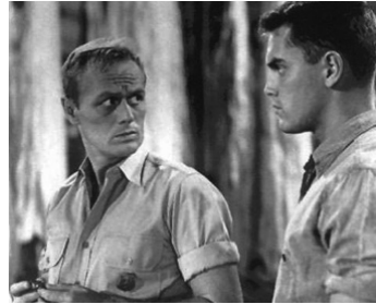
1951 DUEL DANS LA FORÊT (Red Skies of Montana) de Joseph M. Newman avec Richard Widmark