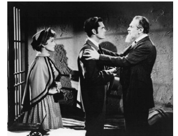
1955 SEVEN ANGRY MEN de Charles M. Warren avec Debra Paget, Raymond Massey