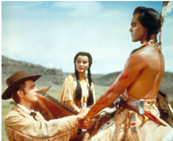
1954 LE DERNIER CHEYENNE (White Feather) de Robert D. Webb avec D. Paget, R. Wagner