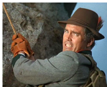
1967 PETIT GUIDE POUR MARI VOLAGE (A Guide for the Married man) de Gene Kelly