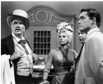
1963 THE MAN FROM GAVELSTONE de William Conrad avec Preston Foster, Grace Lee Whitney