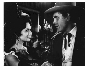
1967 JOE NAVIDAD (The Christmas Kid) de Sidney W. Pink avec Perla Cristal