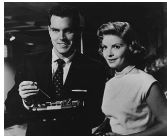
1957 LES SENSUELS (No Down Payment) de Martin Ritt avec Patricia Owens