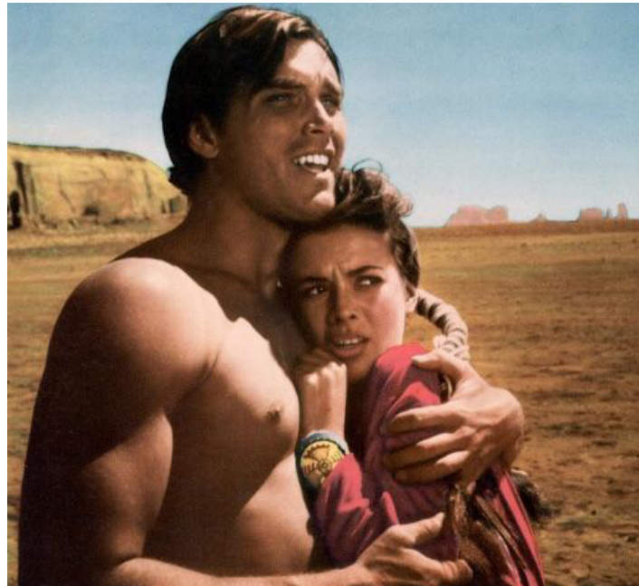
1955 LA PRISONNIÈRE DU DÉSERT (The Searchers) de John Ford avec Natalie Wood