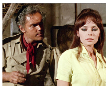
1968 RINGO, CHERCHE UNE PLACE POUR MOURIR de G. Carnimeo avec Pascale Petit