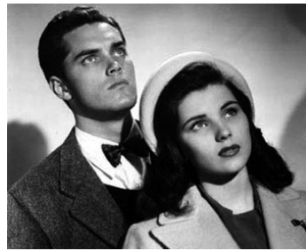
1950 QUATORZE HEURES (Fourteen Hours) de Henry Hathaway avec Debra Paget