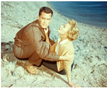
1957 LE CHEMIN DE L'OR (No Way to the Gold) de Robert D. Webb avec Sheree North