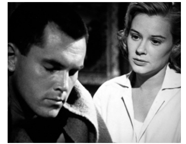
1958 LE TEMPS DE LA PEUR (In Love and War) de Philipp Dunne avec Hope Lange