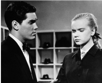
1952 UN GRAND SÉDUCTEUR (Dreamboat) de Claude Binyon avec Anne Francis