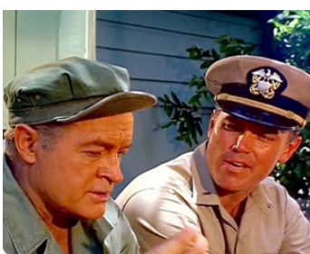
1968 THE PRIVATE NAVY OF SGT O'FARRELL de Frank Tashlin avec Bob Hope