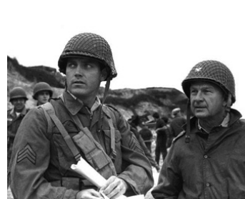
1962 LE JOUR LE PLUS LONG (The longest Day) d'Andrew Marton avec Eddie Albert