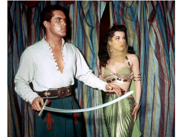
1954 LA PRINCESSE DU NIL (Princess of the Nile) de Harmon Jones avec Debra Paget