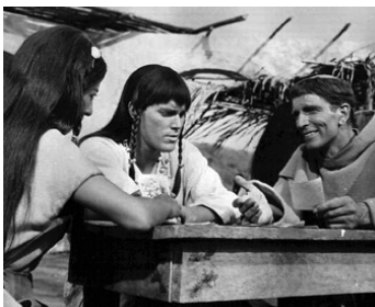
1955 LE SECRET DES 7 CITÉS (Seven Cities of Gold) de R. Webb avec Rita Moreno, Michael Rennie