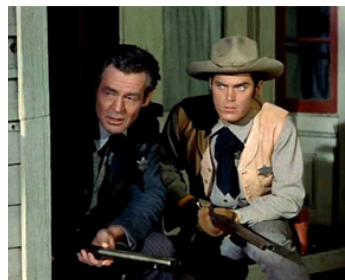
1956 LE SHÉRIF (The Proud Ones) de Robert D. Webb avec Robert Ryan