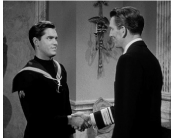
1953 MARIN DU ROI (Sailor of the King) de Roy Boulting avec Michael Rennie