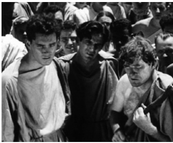
1949 JULES CÉSAR (Julius Caesar) de David Bradley