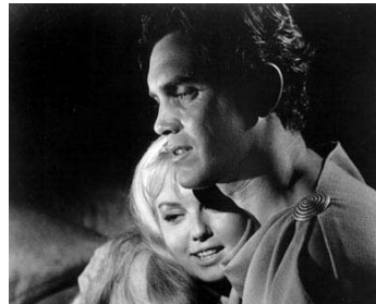
1963 DE L'OR POUR CÉSAR (Gold for the Caesars) d'André de Toth avec Mylène Demongeot